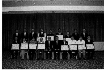
◆撮影協力/(株)登別グランドホテル

登別商工会議所会員企業に勤めている従業員の方で、5年以上勤続して功労があり、他の模範と認められる方(パートタイマーやアルバイト等も可)