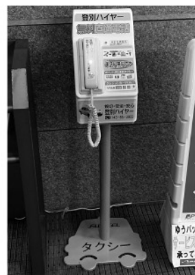
登別中央ショッピングセンター正面玄関に設置している無料電話機