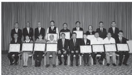
<株登別グランドホテル>