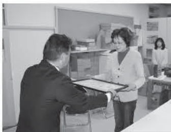
<株のぼりべつ酪農館>