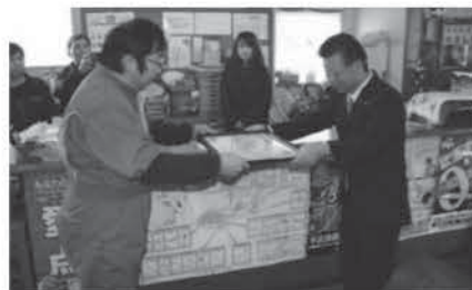
<オートサービスとよしま>