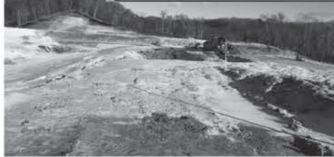
建設中の管理型最終処分場（登別事業所）